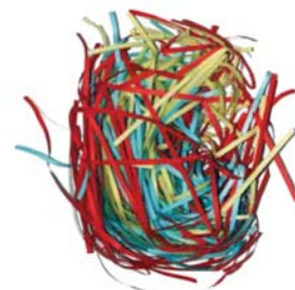
Stripe kutt 3,8 mm